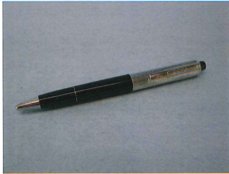
(写真 1) 試料